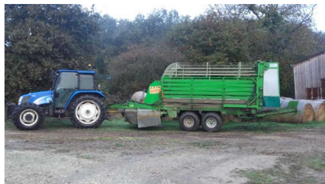
Autochargeuse = 15 000 €

Ainsi ses chèvres ont du vert durant 8 mois de l'année.