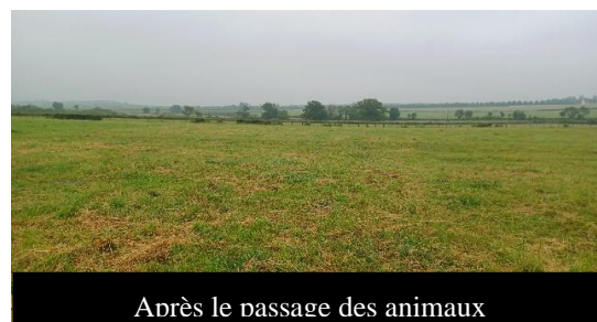
Après le passage des animaux