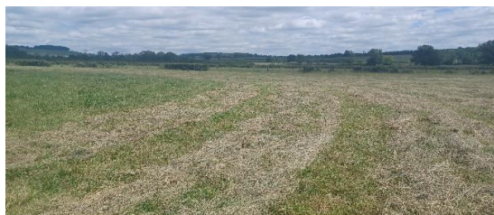
Fauche des refus

Faucher à 6-7 cm. La surface fauchée doit correspondre à 2-3 jours consommables par le lot s'il ne pleut pas.