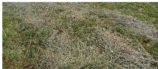
Fauche des refus